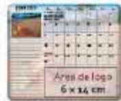
Fondo de color imagen