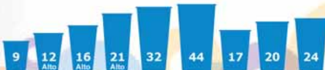
Tamaño de Vasos en onzas